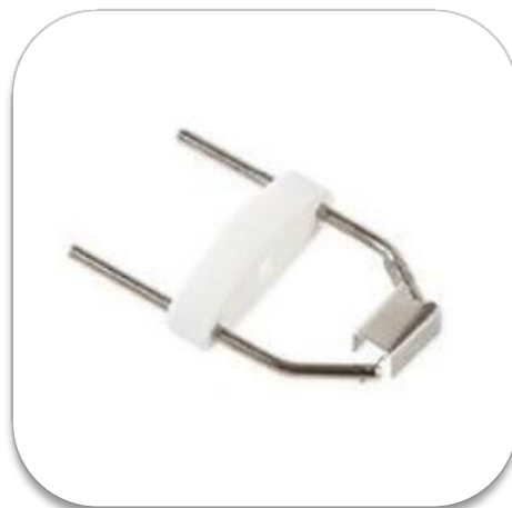
Žhavicí vlákno (filament) pro MS Agilent 5972, 5973, 5975, 5977 a 7000 (MSD a TAD) (10-60061)